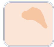
面のような固まり

ケーキングができる原因は、肌に残っていたスキンケアの水分や油分、汗や皮脂などがついたスポンジを介してファンデーションの表面に付着し、そのままスポンジで力を入れて使用し続けることで、粉体と粉体がくっついて表面に粒や固まりができることがあります。