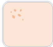
点々・ブツブツした固まり

プレストタイプのツーウェイファンデーションやチーク・アイカラー・プレストパウダーは粉体を押し固めて作っています。使用中に一か所に力が加わったり同じ場所を繰り返し使用することで、下記の図のような固まりができる場合があります。この現象を「ケーキング」と言います。